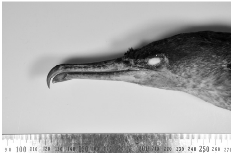
Figuur 2. De kop van Grote Aalscholver NMR9989-2496, verzameld op 25 augustus 2008 De Volharding, Texel. Head of Atlantic Great Cormorant with catalogue number NMR9989-2496, collected on beach De Volharding, Texel, 25 August 2008