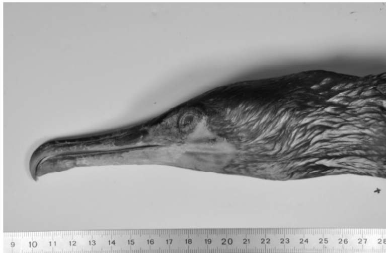
Figuur 1. De kop van Grote Aalscholver NMR9989-3255, levend gevonden op 16 december 2010 in Dordrecht en 21 jaar eerder geringd op La Maitre Ile. Head of Atlantic Great Cormorant with catalogue number NMR9989-3255, found alive on 16 December in Dordrecht and banded 21 years before on La Maitre Ile