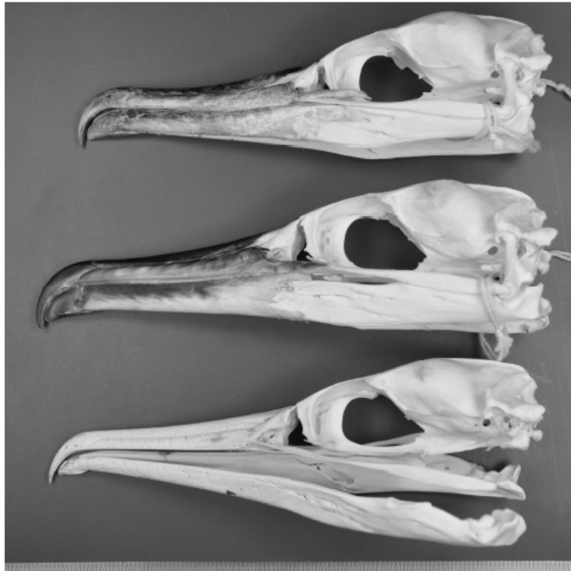
Figuur 3. Schedel van Grote Aalscholver P.c. carbo NMR9989-3255, verzameld op 10 november 1990 op de Maasvlakte (onder). Ter vergelijking daarboven (midden) een schedel van een Grote Aalscholver van Isle of May, Engeland uit 1987 en (boven) een Continentale Aalscholver P.c. sinensis van de Maasvlakte 1987. Skull of Atlantic Great Cormorant with catalogue number NMR9989-3255, collected on Maasvlakte at the bottom. For comparison in the middle an Atlantic Great Cormorant skull from the Isle of May, England 1987 and at the top a Continental Great Cormorant skull from Maasvlakte 1987.

Het derde exemplaar in de collectie is eveneens recent ingediend. Dit skelet, met catalogusnummer NMR9989-2604, is van een adult mannetje dat op 10 november 1990 werd opgeraapt langs de Blokkendam op de Maasvlakte. Op basis van het formaat staat dit exemplaar als een Grote Aalscholver te boek. Omdat de keelzak van