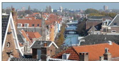
▲ Oude pandjes en de Oude Rijn, karakteristiek voor de Leidse binnenstad. (Wouter Moerland)

vogels op het nest en worden er ook nauwelijks nog doortrekkende exemplaren gezien. Zodra er jongen zijn, en dat kan al vanaf de tweede helft van juni, zijn de ochtenden en avonden voor ons lucratieve tijden om nesten te vinden. Dan maken de oudervogels volop vluchten rondom de nesten om de wachtende jongen te voeden. Vroeg in de ochtend, vóór zevenen, met windstil en zonnig weer kan het bij de nesten al een drukte van belang zijn. Van onder de dakpannen zijn dan bedelende jongen te horen. Het speuren naar poepsporen onder de lijsten en dakpannen kan ook goed helpen bij het ontdekken van een nest. In juli zijn de jongen volgroeid en moeten zij op eigen vleugels door het leven.