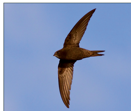
▲ Het karakteristieke vliegbeeld van een gierzwaluw. (Garry Bakker)

Vanaf mei hebben wij het oude, door de singels omsloten centrum van de stad doorkruist. Dit deel van de stad bestaat uit een wirwar van steegjes, grachten en markten. Historische panden van vóór 1700 zijn gewoon; plaatselijk heeft vooroorlogse bebouwing plaatsgemaakt voor nieuwbouw. Laaggierende gierzwaluwen vormen een eerste aanwijzing voor broedactiviteit. Hoewel gezegd wordt dat de soort trouw is aan zijn nestplaats, worden ook zoekende dieren waargenomen. De vogels vliegen hierbij van gevel naar gevel, alsof de plekken onderzocht worden op nestruimte. In juni is het stiller, dan zitten de meeste