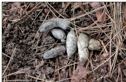
▲ De vos van de Zuiderbegraafplaats te Rotterdam werd nooit gezien, maar de keutels onder reigernesten verraadde zijn aanwezigheid; 20 maart 2006.

Veel mensen vragen zich af wat de komst van de vos in onze stad voor gevolgen gaat hebben. Vormt de soort een risico voor de volksgezondheid? En welke overlast brengen vossen met zich mee? In het rapport dat bSR over de vos in Rotterdam heeft geschreven wordt uitgebreid op deze kwesties ingegaan (De Zwarte et al. 2011). De belangrijkste conclusie is dat u er waarschijnlijk niet veel van gaat merken. Vossen zijn schuwe dieren die ook in stedelijk gebied contact met mensen zullen vermijden. De kans dat u direct in aanraking komt met een wilde vos is daarom, ook in delen van de stad waar veel vossen rondlopen, klein. Daardoor, en vanwege het feit dat West-Nederlandse vossen vrijwel geen gevaarlijke ziektes dragen, is de kans op ziekteoverdracht zeer klein. Huisvuil plunderen