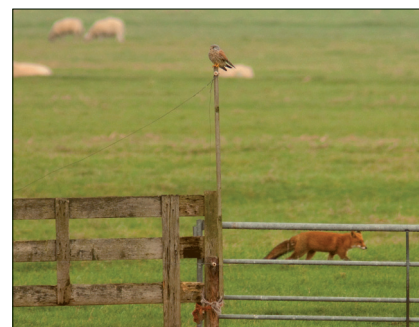
▲ Torenvalk en vos zijn beide fanatieke muizenjagers. Hier passeren ze elkaar in polder Schieveen, op 3 november 2009.

In de omgeving van Rotterdam was één van de eerste vaste burchten die werd ontdekt die van de Akerdijkse Plassen in 2005. Vervolgens namen de waarnemingen toe in aangrenzende gebieden: polder Schieveen, het Lage Bergsche Bos, de Noordoost-Abtspolder (DOP-NOAP) en het Schiebroekse Park. De deur om verder de stad in te trekken stond vanaf dat moment wagenwijd