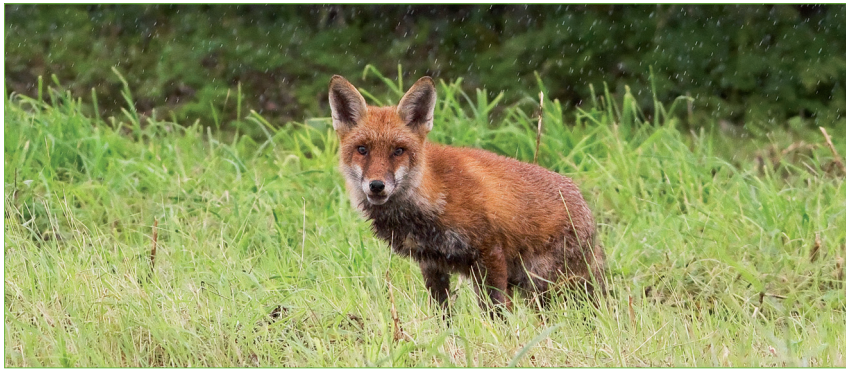
▲ Vos in de regen op De Esch in Rotterdam; 29 augustus 2010.

open. Bewoners van Terbregge begonnen sinds 2006 vossen te melden, net als wandelaars en hondenbezitters in Park Zestienhoven en het Kralingse Bos. Op de campus van de Erasmus Universiteit aan de Laan van Woudestein in Kralingen figureert een vos regelmatig op videobeelden van de beveiliging.