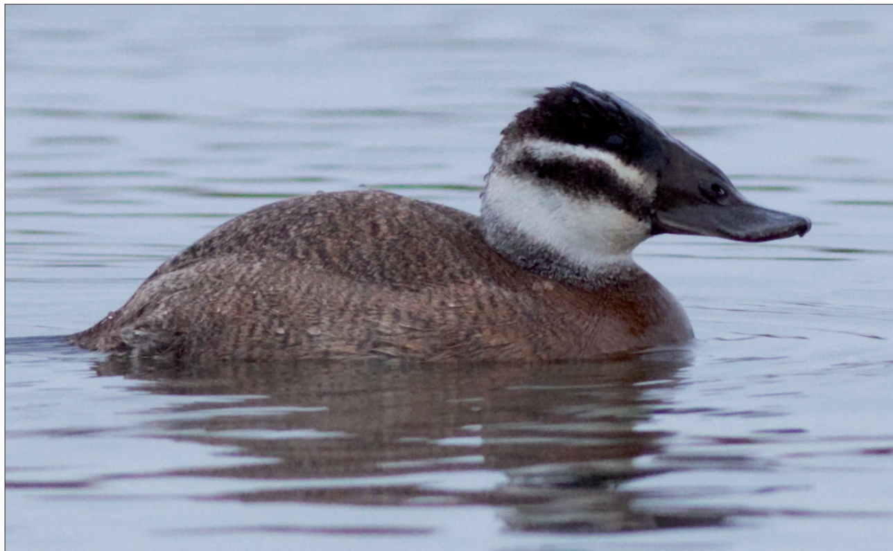
▲ Witkopeend, Zevenhuizerplas, 14 februari 2010.