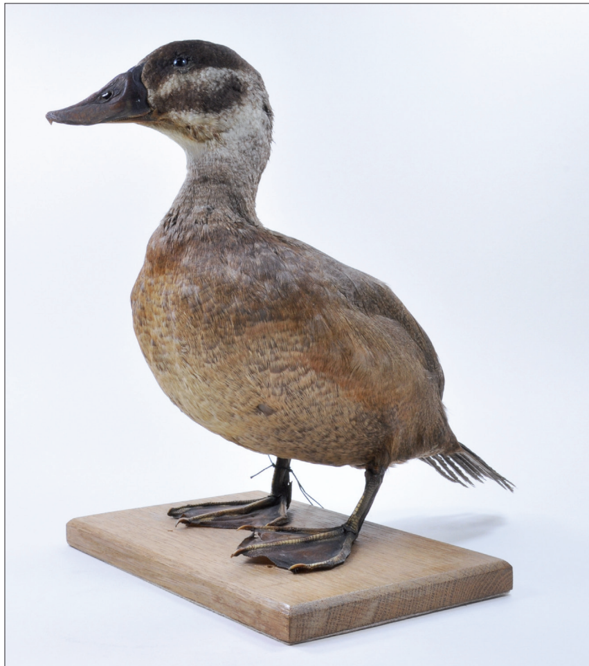
▲ De witkopeend van het Schollevaarseiland, maart 1851; collectie Natuurhistorisch Museum Rotterdam, NMR 9989-001296.